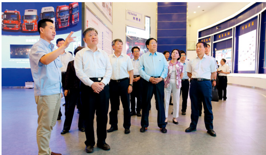
6月23日，全国人大常委会副委员长陈竺（前左二）率全国人大常委会企业破产法执法检查组在陕西汽车控股集团视察。

开展法律宣传，破产法治意识不断增强。各级党委、政府和法院高度重视企业破产法的贯彻实施工作，大力开展