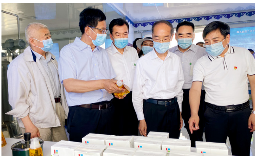
全国人大常委会副委员长万鄂湘(右三)率全国人大常委会畜牧法执法检查组在内蒙古呼伦贝尔农垦集团谢尔塔拉农牧场开展执法检查。