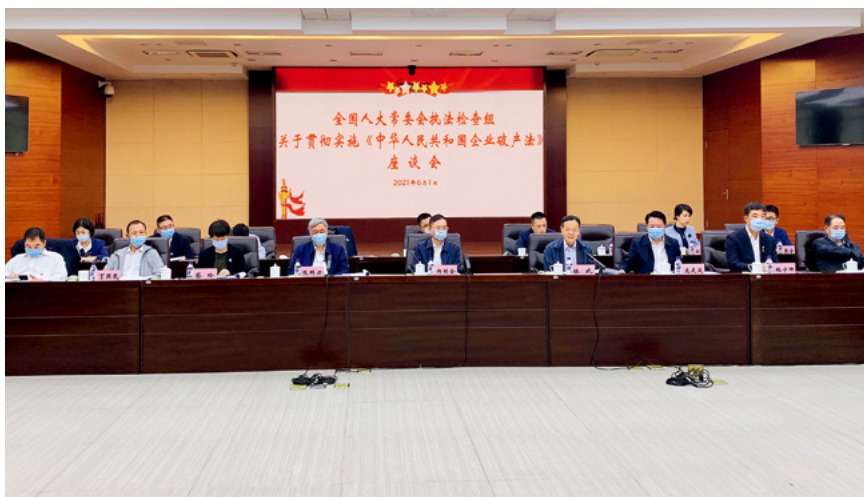
5月31日至6月5日，全国人大常委会副委员长郝明金率（中）全国人大常委会企业破产法执法检查组在吉林省、山西省开展执法检查。图为6月1日下午，执法检查组在吉林省长春市中级人民法院召开座谈会，听取实施企业破产法情况汇报。