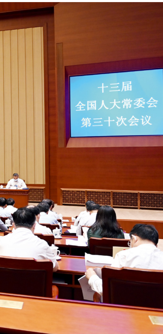
十三届全国人大常委会第三十次会议17日上午在北京人民大会堂举行第一次全体会议。栗战书委员长主持。