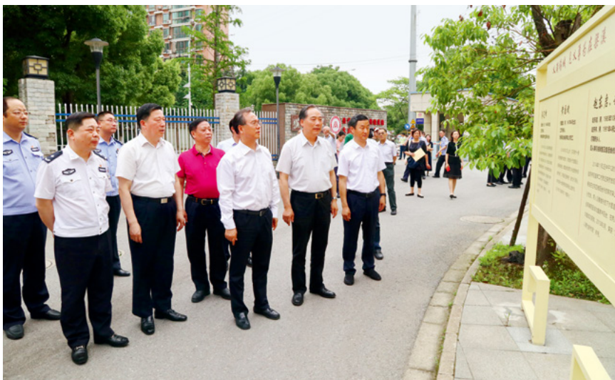
5月28日，无锡市人大常委会对《无锡市奖励和保护见义勇为人员条例》实施情况开展执法检查。