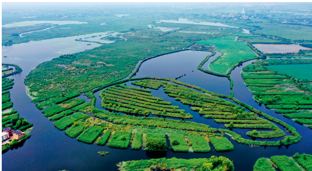
白洋淀生态环境持续改善，“华北明珠”重放光彩。图为8月14日拍摄的白洋淀风光（无人机照片）。