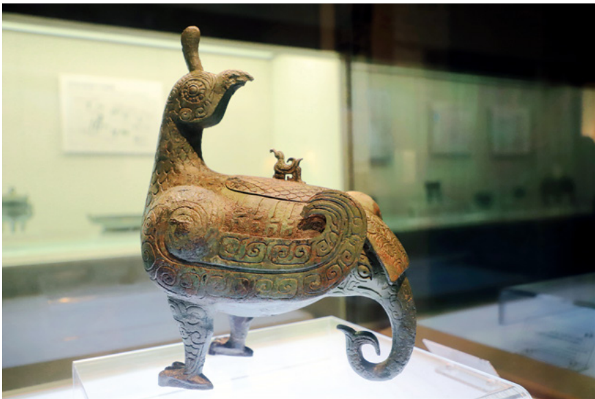
有关部门始终坚持保护第一的原则,文物保护状况明显改善。全国不可移动文物76.67万处,国有可移动文物1.08亿件套。图为山西博物院所藏鸟尊。

中华文明源远流长。从20世纪20年代发掘殷墟,到近年来海昏侯墓、江口沉银遗址等发掘,中国考古学经过不断的发展,为我国历史研究作出了突出贡献。