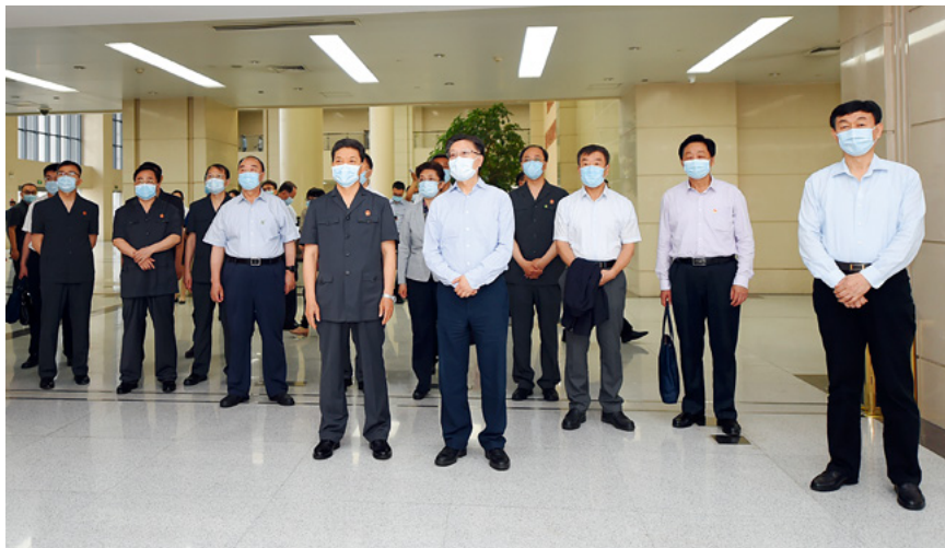
6月3日，全国人大常委会副委员长王东明（前左二）率全国人大常委会企业破产法执法检查组赴山东省高级人民法院检查法律实施情况。