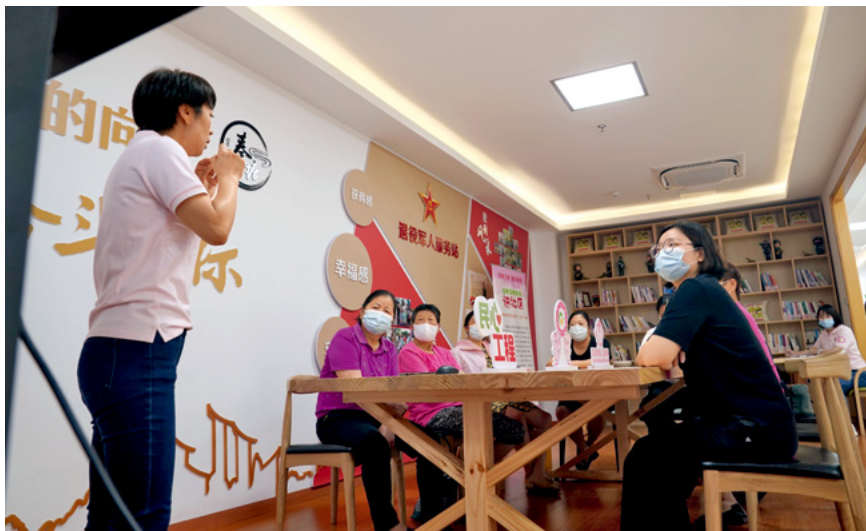
7月14日，在上海市奉贤区奉浦街道秦塘生活驿站，早教专家为家长们提供亲子阅读、亲子游戏、营养健康、幼儿意外伤害急救等指导。

“建议草案完善国家对农村留守儿童家庭教育支持的有关规定，明确倾斜支持政策，促进农村留守儿童健康成长。”李钺锋说。✘