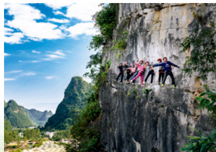
游客在马山县古零镇岩壁上体验飞拉达项目

金秀瑶族自治县以全域旅游示范区创建为契机,以推进贫困村整体脱贫和贫困户持续增收为核心目标,围绕自然生态、瑶族文化、养生健康三大旅游品牌的打造,持续、深入推进旅游扶贫工作。2019年,金秀入选首批国家全域旅游示范区,旅游扶贫成为群众脱贫致富的有力推手。2016—2019年,金秀通过打造文旅品牌,带动4000人以上脱贫致富。