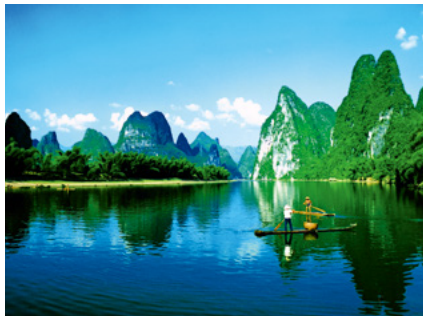
桂林漓江黄布倒影景观