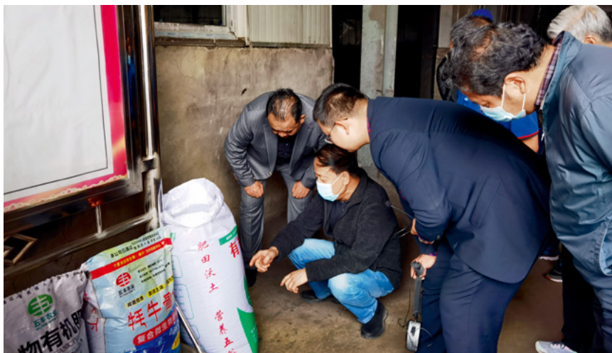
全国人大常委会副委员长武维华(左二)率全国人大常委会畜牧法执法检查组在青海省海晏县金銀滩牛羊标准化养殖示范牧场有限公司开展执法检查。