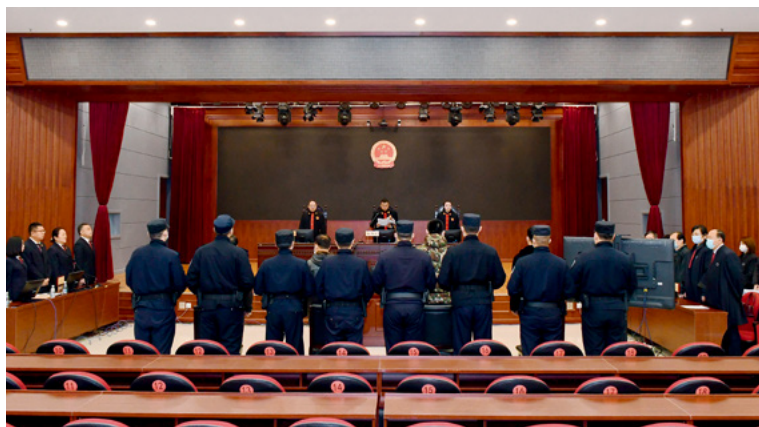
2020年11月20日,黑龙江省22家法院对38件黑恶势力和“保护伞”案件集中宣判,涉案的227名被告人被判处刑罚,最高被判处无期徒刑。这是在牡丹江市中级人民法院拍摄的宣判现场。

增加对犯罪嫌疑人、被告人采取异地羁押、分别羁押或者单独羁押等措施依法通知其家属和辩护人的规定。明确公安机关采取技术侦查、控制下交付等措施应当依照刑事诉讼法的规定进行。