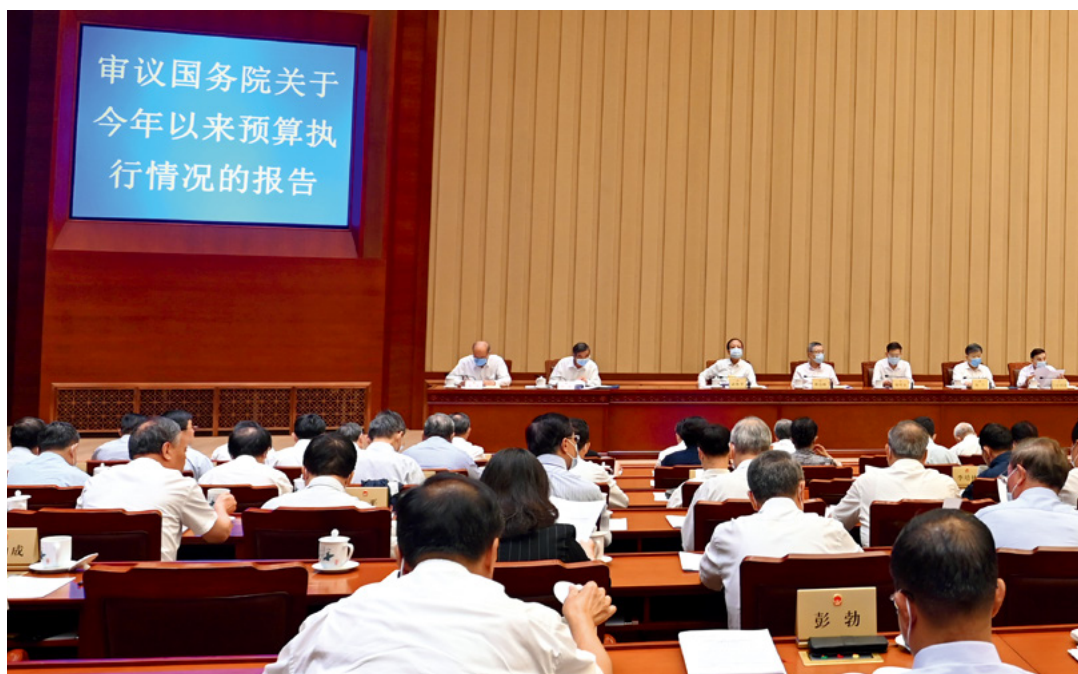
8月18日下午，十三届全国人大常委会第三十次会议举行第二次全体会议，听取国务院关于今年以来预算执行情况的报告。

全国各地财政收入普遍回升，地区间收入分化格局依然延续；四是财政支出压一般、保重点，基本民生支出得到较好保障。