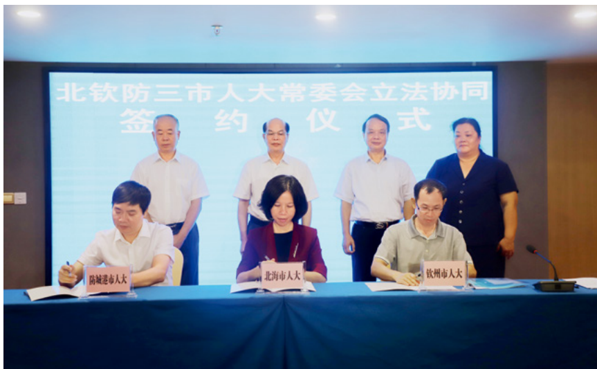
2020年6月17日，广西北海、钦州、防城港三市就立法协同的框架、机制等达成共识，签订《关于深化北钦防三市人大常委会立法协同的协议》。

党的十八大以来，习近平总书记多次对广西发展作出重要指示批示，赋予广西“三大定位”新使命，提出“五个扎实”新要求，为新时代广西发展把脉定向、擘画蓝图。2021年4月25日至27日，习近平总书记再次亲临广西视察，对广西工作提出了“四个新”的总要求及四个方面的具体要求。习近平总书记深刻指出，推动经济高质量发展，既要深刻认识贯彻新发展理念、构