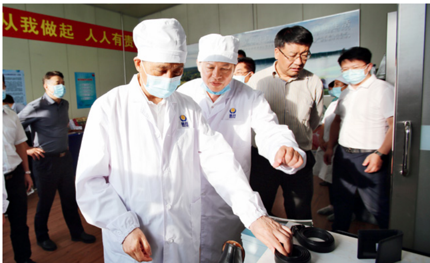
全国人大常委会副委员长吉炳轩(前左一)率全国人大常委会畜牧法执法检查组在吉林省长春皓月集团开展执法检查。

在青海、云南开展执法检查时,武维华副委员长指出,要准确把握新时代、新征程对畜牧业发展提出的新目标、新要求,依法推进畜牧业高质量发展。要立足新发展阶段,处理好优化畜牧业生产结构与完善畜牧业产业链价值链之间的关系。要贯彻新发