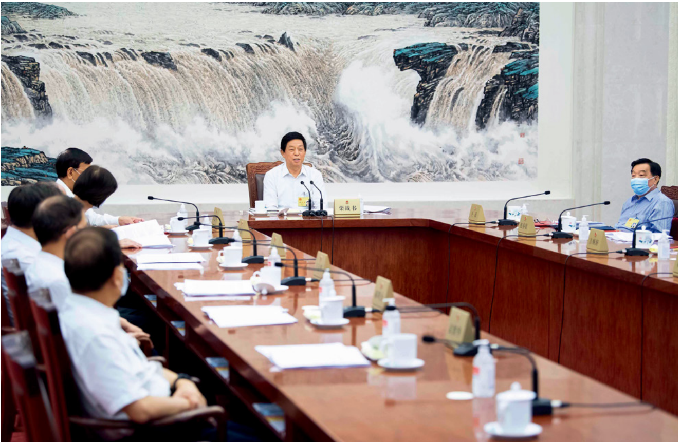
8月19日，十三届全国人大常委会第九十九次委员长会议在北京人民大会堂举行。栗战书委员长主持会议。摄影/新华社记者 李 涛