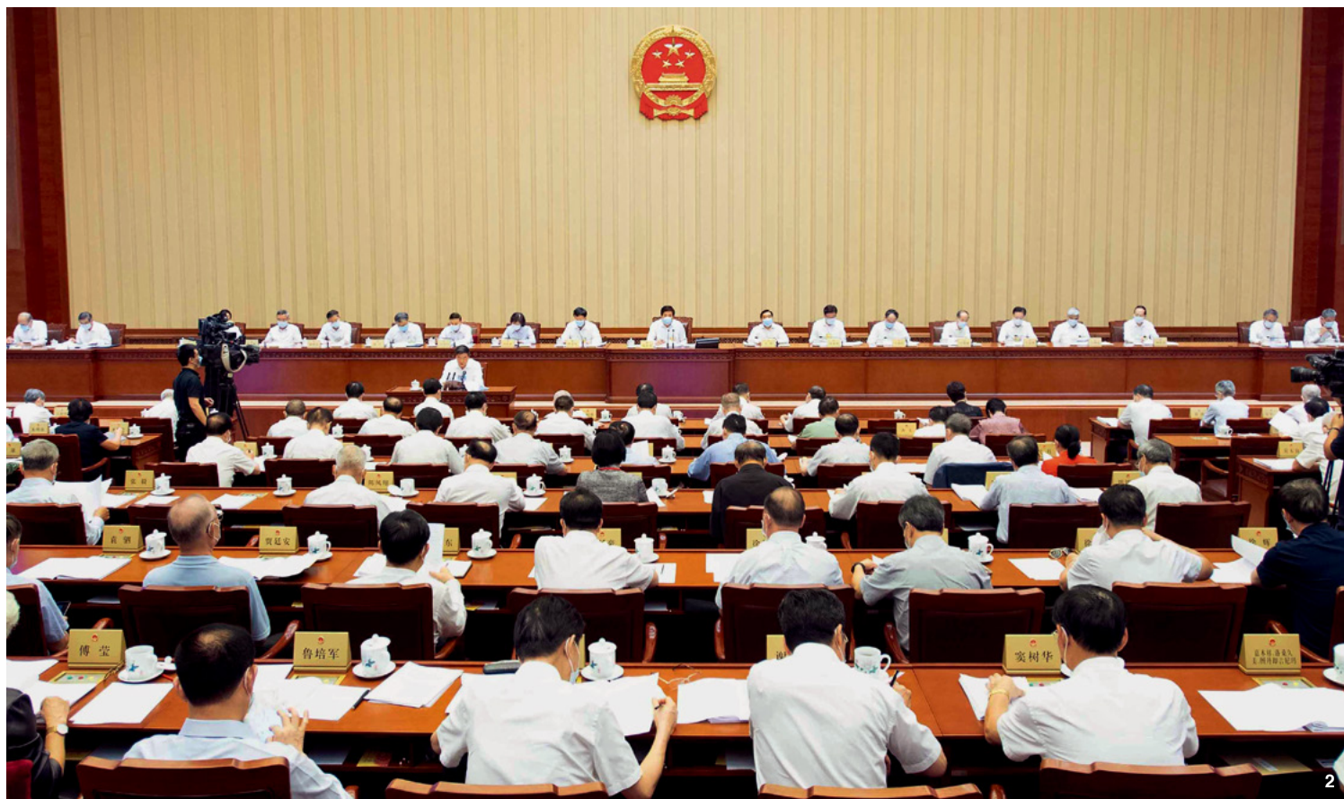
④ 8月17日下午,十三届全国人大常委会第三十次会议举行分组会议,审议医师法草案、兵役法修订草案、人口与计划生育法修正草案等。