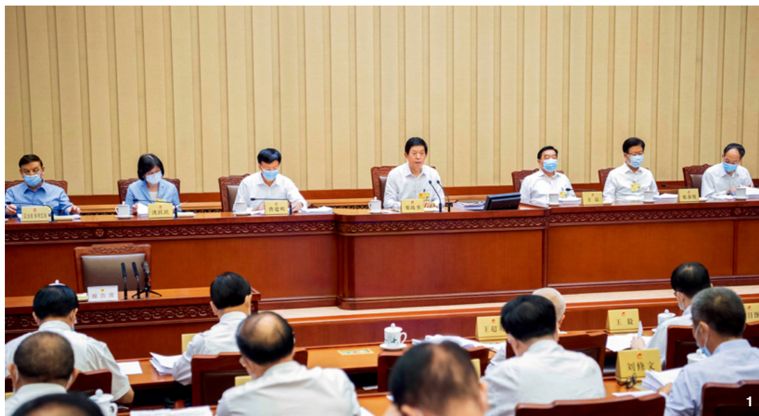
① 8月17日,十三届全国人大常委会第三十次会议在北京人民大会堂举行第一次全体会议。栗战书委员长主持。