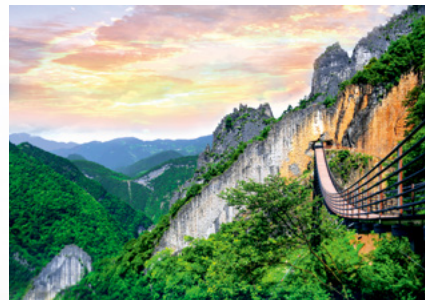
武陵山大裂谷景区—天门洞索桥

全国文明城区、国家卫生区，在重庆主城新区中率先建成百亿级商圈，三级医院数量达到3家，教育质量保持区域领先，新型智慧城市建设水平位居全市前列，城市建成区面积达到73平方公里，人均公园绿地面积17.7平方米，森林覆盖率达52%，长江、乌江涪陵段水质总体为优，2020年城区空气质量优良天数创历史新高、达到345天。着力打造成渝地区“后花园”，积极融入巴蜀文化旅游走廊建设，白鹤梁题刻申遗工作顺利推进，“世界第一大人工洞体”“三线精神丰碑”816工程上榜中国首批工业遗产保护名录，地质奇观武陵山大裂谷以高分通过国家5A级景区景观质量评审，中国水文物博物馆、巴王陵遗址博物馆、北岩书院等项目务实推进，白鹤梁题刻文化、易理文化、榨菜文化、枳巴文化、三线文化、庄园文化等特色地域文化在历史传承中延续魅力，全区年接待游客突破2300万人次，山水涪陵正在成为“近悦远来”的美丽之地。