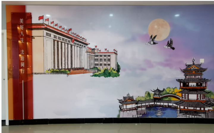
江东街道鸡鸣山社区联络站墙上，以“义乌市人大常委会基层立法联系点”为主题的图画。

民主立法、促进经济社会发展的战略举措。”义乌市人大常委会副主任胡爱芬介绍，完善的制度建设是践行好基层立法联系点使命任务的坚强保障，义乌市人大常委会探索构建起“1+3+X”基层立法联系点工作网络：“1”是设立义乌基层立法联系点办公室，增加行政编制3名；“3”是征询单位、联络站、立法咨询专家库三大立法建议收集平台，其中征询单位侧重使行政单位发挥职能部门优势，联络站负责收集乡村、社区、企业、律所等的意见建议，侧重发挥深入基层群众的优势；“X”是立法联络员、信息采集员、人大代表、基层群