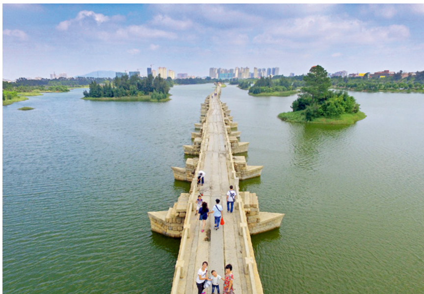
泉州市安平桥，又名五里桥。

泉州古称刺桐城，地处福建东南沿海、台湾海峡西岸，为东海与南海的分界处，湾多水深，建港条件优越。早在唐代，泉州就是我国的四大对外贸易港口之一。随着造船与航海技术的进步，东南沿海的海运业发展迅速。历经晋人南迁等三次中原人口南下大潮，泉州呈现空前的大繁荣景象。宋代朝廷在泉州设立市舶司，统一管理海关与外贸