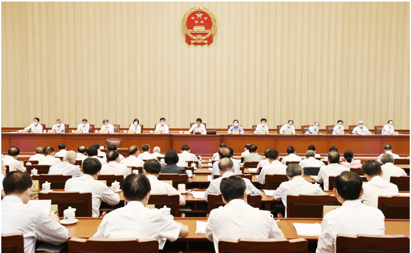
8月20日，十三届全国人大常委会第三十次会议在北京人民大会堂闭幕。栗战书委员长主持会议。