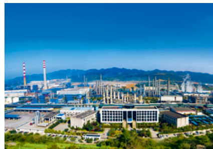
重庆华峰新材料产业园

三、坚定走生态为本、人文为魂的城市发展之路，在创造高品质生活上争做样板。 “十三五”时期，涪陵区围绕建设百万城市人口现代化城市，彰显大山大水、大开大阖、大收大藏的城市气质，着力提升城市品质，一次成功创建