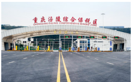
重庆涪陵综合保税区

“十三五”时期，涪陵区地区生产总值超过1200亿元、年均增速8.3%，人均地区生产总值突破10万元，人口实现持续净流入。