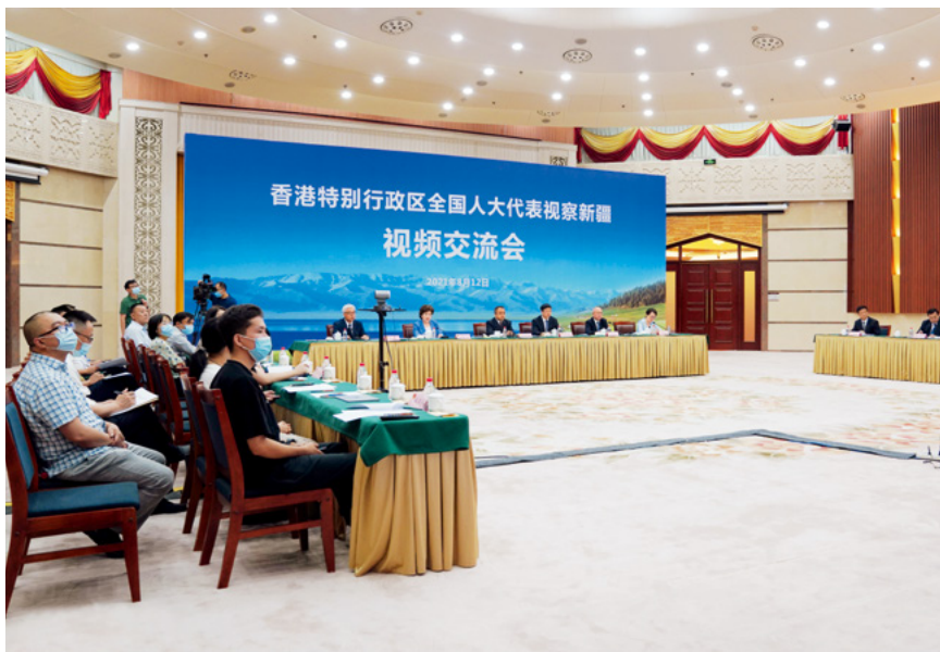
近期，香港全国人大代表视察新疆交流会，以视频连线的方式举行。图为新疆主会场。

新疆维吾尔自治区党委常委、人民政府副主席艾尔肯·吐尼亚孜对香港全国人大代表视察新疆表示热烈欢迎。他介绍，在以习近平同志为核心的党中央坚强领导下，新疆经济社会稳定发展，民族团结和睦友爱，民生事业明显改善，脱贫攻坚取得全面胜利，对外开放不断深化，各族人民群众的获得感、幸福感和安全感持续增强。当前的新疆，处于历史上最好的繁荣发展时期。尽管一些西方国家罔顾事实，谎言污蔑，企图破坏安全稳定大局，但是阻挡不了新疆奋力前进的步伐。希望大家在疫情好转后到新疆实地考察指导，感受新疆人民的热情好客，领略天山南北