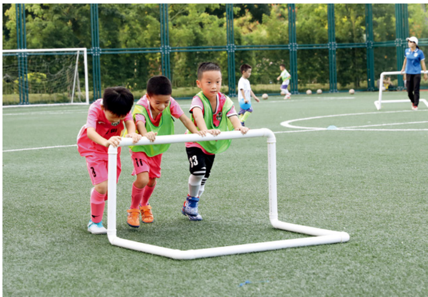
9月4日，广州市二沙岛体育公园内，孩子们在推球门架。

生子女的数量大概是2亿左右，失独家庭在2010年统计的数字已突破100万，此后每年以6万到7万的速度递增。