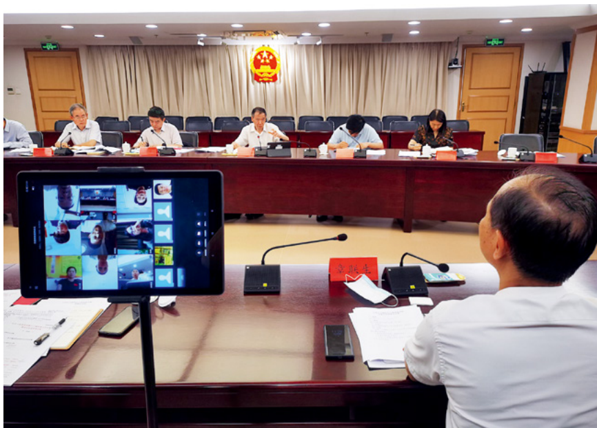
6月下旬，全国人大教科文卫委员会副主任委员吴恒就“修改国境卫生检疫法”“制定中医药传统知识保护法”“修改疫苗管理法”“修改基本医疗卫生与健康促进法”“修改传染病防治法”等5件议案办理工作进行调研时，邀请了近30位联名提出议案的代表，通过信息化平台视频参会。

在银保监会召开金融支持乡村振兴座谈会时，邀请9位不能到场的代表，以视频方式参会。座谈会上，代表在加大乡村振兴金融投入、健全乡村