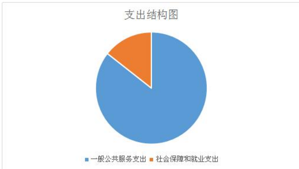
2021 年度本年支出结构图

(2) 社会保障和就业支出 37.96 万元，用于全国人大机关采购中心开支的行政事业单位离退休经费支出。较 2020 年决算减少 1.92 万元，减少 4.81%。